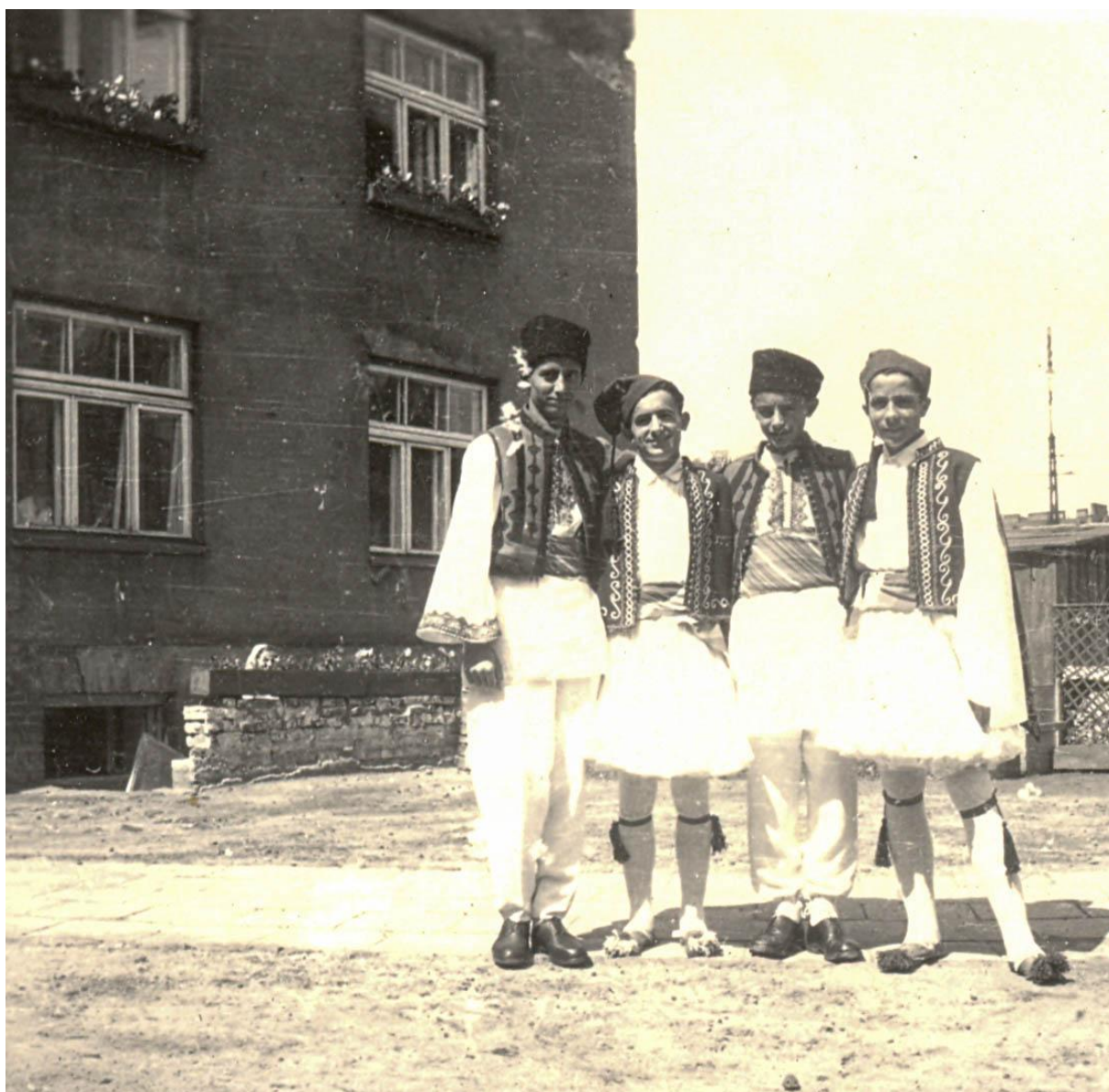
Młodzi uchodźcy z Grecji w Szczecinie.

Warszawy 75). W pierwszym roku przeniesiono tam ok. 700 wychowanków z Polic. Do 1956 r. greccy osadnicy nie mieli prawa samowolnej zmiany miejsca zamieszkania. Gdy zakaz anulowano, wiele rodzin zaczęło swoje prywatne odyseje, szukając odpowiedniego miejsca do życia. Część Macedończyków wyjechała do Bułgarii i Jugosławii. W Polsce preferowano duże ośrodki miejskie, w których łatwiej było o niwelowanie różnic kulturowych i językowych. Najtrwalsze skupiska greckie przetrwały w miastach, m.in. w Szczecinie, w którym już w 1951 r. mieszkało około 500 uchodźców. Władze kładły szczególny nacisk na zapewnienie im stałego zajęcia. Wśród osób dorosłych prowadzono kursy zawodowe, połączone z nauką języka polskiego.