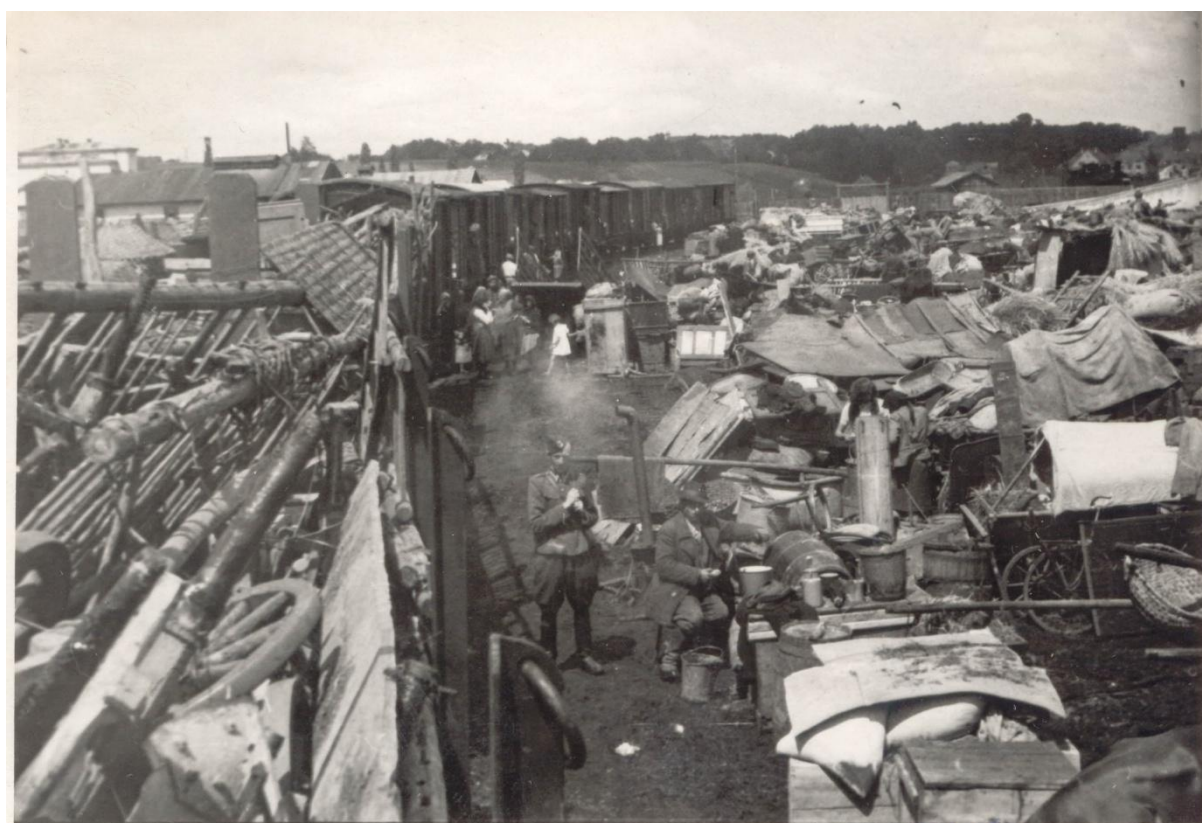
Przesiedlenie ludności ukraińskiej w ramach akcji "Wisła", 1947 r.

Represje objęły m.in. obszar Łemkowszczyzny, na którym UPA nigdy nie miała realnego poparcia. Na listach deportacyjnych znalazły się rodziny mieszane, zdemobilizowani żołnierze LWP, członkowie PPR oraz setki osób, które nie miały zdefiniowanej ukraińskiej świadomości narodowej. Przesiedleni pozostawili dorobek wielu pokoleń, zasiane pola i groby bliskich. Zniszczeniu uległy wsie, opustoszały cerkwie, bezpowrotnie ztracono miejscowe, unikatowe dziedzictwo kulturowe takich grup etnicznych jak Dolinianie, Łemkowie i Bojkowie. Z województw krakowskiego, lubelskiego, rzeszowskiego wysiedlono łącznie 33 154 rodziny (140 662 osoby), z czego prawie 49 tys. osób trafiło na teren Pomorza Zachodniego. Celem akcji „Wisła” było maksymalne rozproszenie ludności ukraińskiej. Wytyczne zakładały oddalenie nowych skupisk osiedleńczych przynajmniej 50 km od granic państwowych oraz 30 km od granic morskich (wykluczono przy tym początkowo 8 nadgranicznych powiatów). Dbano także o to, aby nie przekroczyć 10-procentowego progu liczebności Ukraińców w danej gromadzie.