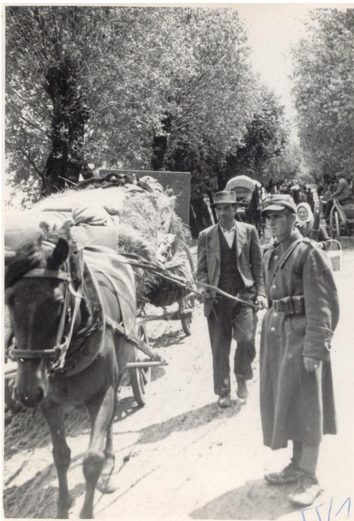
Przesiedlenie ludności ukraińskiej w ramach akcji "Wisła", 1947 r.

ludnością ukraińską kierowano do punktów rozdzielczych, skąd w mniejszych grupach rozsyłano do stacji docelowych. Rodziny które posiadały żywy inwentarz kierowano do gospodarstw indywidualnych, resztę (około 3,5 tys. osób) do Państwowych Nieruchomości Ziemijskich (PNZ). Po dwóch latach polskiej bytności na tzw. Ziemiach Odzyskanych zmniejszeniu uległa baza zasiedlanych gospodarstw: te, które zostały do dyspozycji przesiedlonych były często zdewastowane.