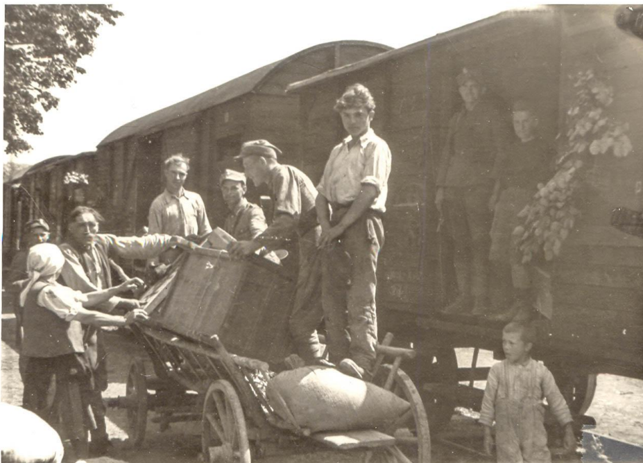
Przesiedlenie ludności ukraińskiej w ramach akcji "Wisła", 1947 r.

W 1947 r. na terenie Pomorza Zachodniego znalazło się 49 tys. Ukraińców przymusowo przesiedlonych w ramach akcji „Wisła”. Plan operacji przesiedlenia ludności ukraińskiej z woj. rzeszowskiego na tereny północnej i zachodniej Polski pojawił się w marcu 1946 r. w gabinetach dowództwa wojskowego. Dzięki temu zamierzano rozbić ostatecznie ukraińską partyzantkę (UPA) i zarazem rozwiązać problem ukraiński przez polonizację (asymilację) przesiedleńców w nowym miejscu osiedlenia. Wsiedlenia ruszyły rankiem 28 kwietnia 1947 r. i trwały do połowy sierpnia. Oddziały wojskowe otaczały kolejne wsie i nakazywały ich opuszczenie, zabierając niewielki dobytek. Jednocześnie przystąpiono do likwidacji ukraińskiej partyzantki. Przesiedlenia objęły nie tylko osoby faktycznie współpracujące z UPA, ale także całe rodziny nie mające żadnych związków z podziemiem, czy wręcz wspierające ówczesny system.