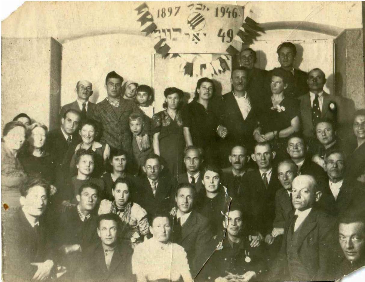
Obchody 49. rocznicy utworzenia partii Bund w Szczecinie, 1946 r.