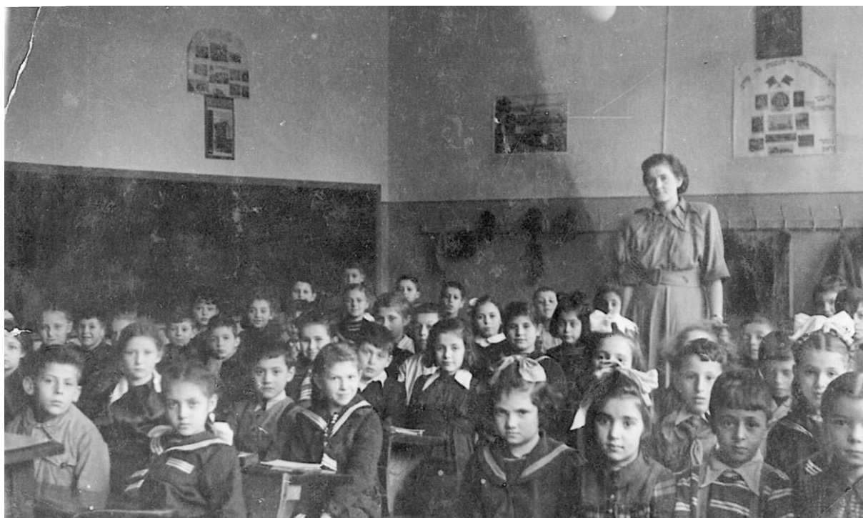
Szkoła podstawowa im. Lejba Pereca w Szczecinie, 1950 r.

żydowskich organizacji. Po powstaniu Izraela coraz więcej osób decydowało się na emigrację. Na opuszczenie kraju oficjalnie zezwolono w komunikacie Ministerstwa Administracji Publicznej z listopada 1949 r. W Szczecinie na wyjazd zapisało się wówczas ponad 2000 osób, głównie robotnicy spółdzielni oraz tzw. inicjatywa prywatna, urzędnicy i inteligencja. Tym samym z mapy Szczecina pomału zaczęły znikać żydowskie instytucje, sklepy, kramy, piekarnie i zakłady fryzjerskie.