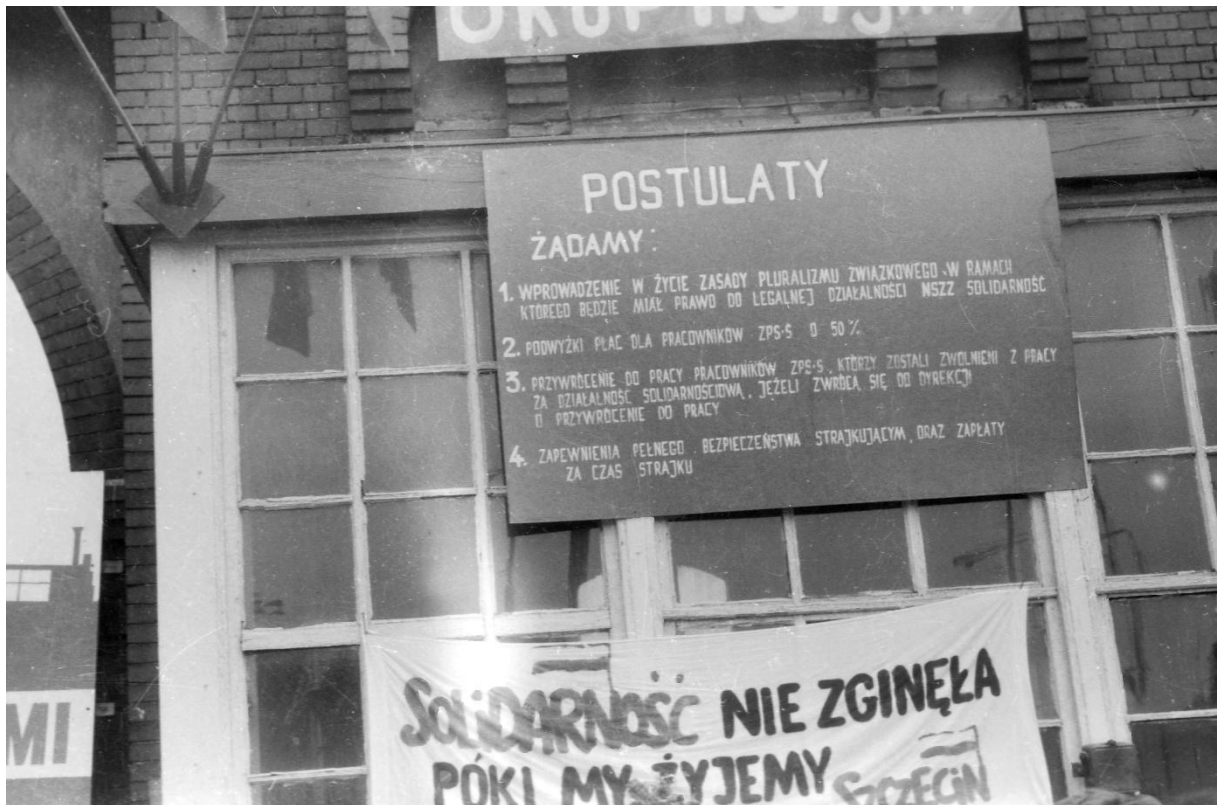
Postulaty strajkujących w szczecińskim porcie, sierpień 1988 r.

tym razem na pierwszy plan zaczęło wysuwać się żądanie przywrócenia pluralizmu związkowego.