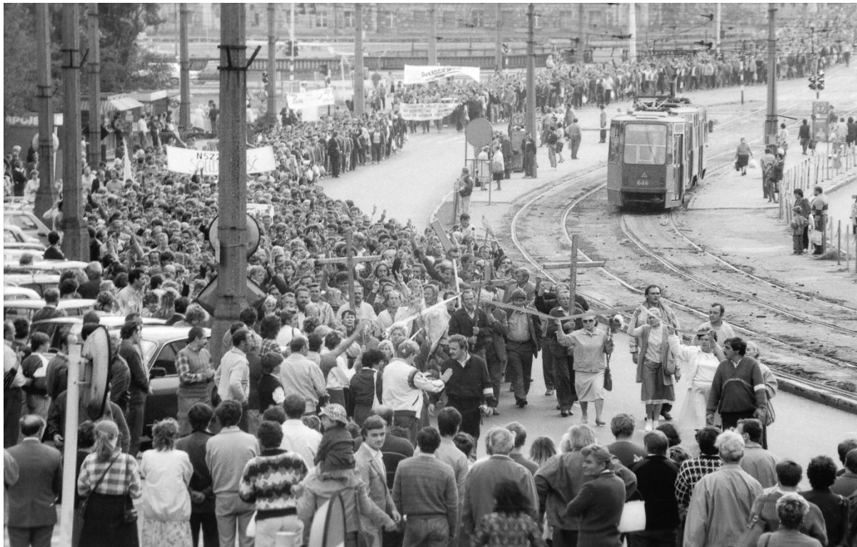
Pochód strajkujących z portu na mszę św. w katedrze po zakończeniu strajku, 3 września 1988 r.