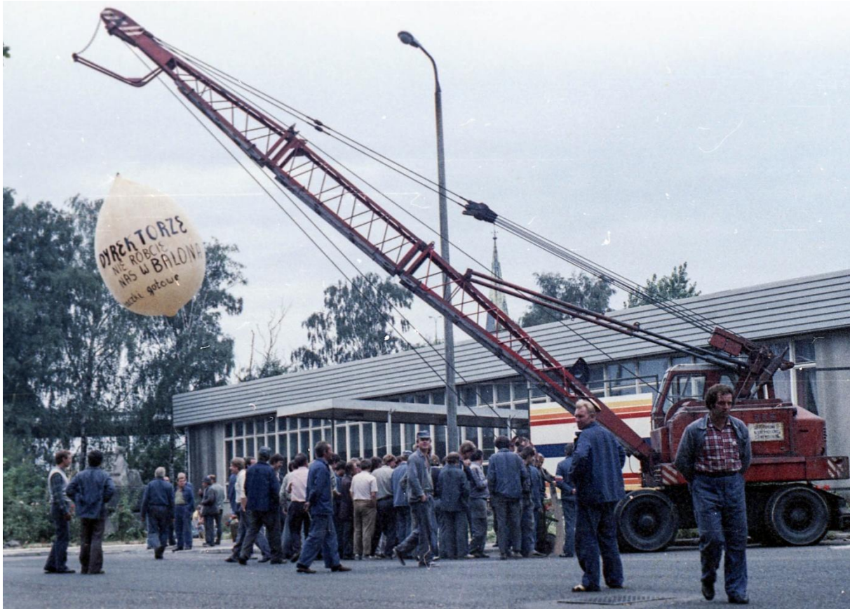
Strajk w szczecińskim porcie, sierpień 1988 r.

jest gotów spotkać się z portowcami pod warunkiem, że zakończą nielegalny strajk, wydała z terenu zakładu osoby niebędące jego pracownikami oraz zniwelują straty wynikłe z dotychczasowego przestoju. Do spotkania strajkujących z gen. Jaruzelskim nie doszło ani w Szczecinie, ani w żadnym innym ośrodku.