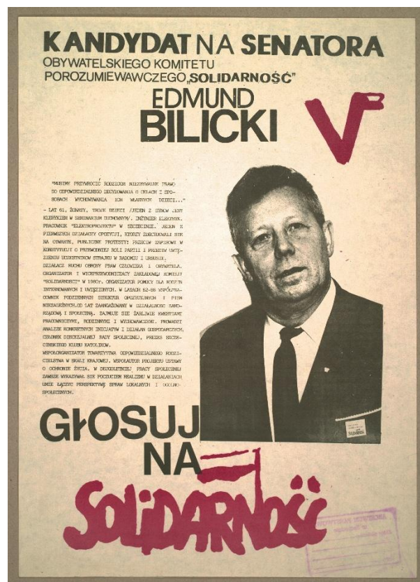
Plakaty wyborcze OKP „Solidarność” w Szczecinie przed wyborami czerwcowymi 1989 r.

Wybory czerwcowe '89 były kluczowym wydarzeniem w procesie pokojowej zmiany ustroju w Polsce. Klęska PZPR i jej sojuszników uruchomiła swoisty efekt domina. Dalsza sekwencja wydarzeń prowadziła poprzez powołanie we wrześniu 1989 r. rządu niekomunistycznego premiera Tadeusza Mazowieckiego, przywrócenie w grudniu 1989 r. tradycyjnej nazwy państwa Rzeczpospolita Polska, samorozwiązanie PZPR w styczniu 1990 r., intensywne reformy gospodarcze prowadzące w kierunku gospodarki wolnorynkowej ujęte w tzw. planie Balcerowicza, wolne wybory samorządowe wiosną 1990 r., wybór jesienią tego roku w bezpośrednim, powszechnym, wolnym głosowaniu Lecha Wałęsy prezydentem RP, aż do pierwszych w Polsce po II wojnie światowej całkowicie wolnych wyborów parlamentarnych w październiku 1991 r. Wydarzenia lat 1988–1989 – ze znaczącym udziałem mieszkańców Pomorza Zachodniego – otworzyły drogę do budowy nowej, pluralistycznej i demokratycznej Trzeciej Rzeczypospolitej.