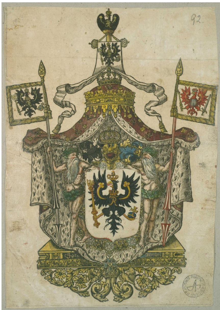
Herb Króla Pruskiego Fryderyka I z 1701 roku. Miedzioryt, papier, wbw, AP Szczecin, AKS I/3515.

Pomorze brandenbursko-pruskie w 1713 roku, w momencie obejmowania tronu przez króla Fryderyka Wilhelma I, stanowiło jedną z głównych prowincji państwa pruskiego. Obejmowało około 370 mil kw. Krótko po objęciu tronu król zaangażował się po stronie koalicji antyszwedzkiej (Rosja, Saksonia, Dania) w trwającą właśnie III wojnę północną (1700-1721). Miało to umożliwić zdobycie Szczecina i ujścia Odry oraz pozostałej części Pomorza, „należnej” władcy z dynastii Hohenzollernów od czasów układu o sukcesji zawartego z książętami pomorskimi w 1529 roku.