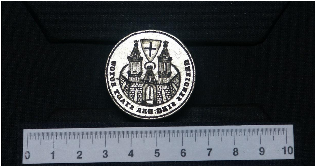
Pieczęć Sądu Miejskiego w Bytowie z XVIII wieku, używana do 1809 roku: GERICHTS SIEG: DER STADT BUTOW – napis w otoku pod rysunkiem z obwódka wzdłuż krawędzi pola typariusza; antykwia, j. niemiecki. Rysunek: zamek z trzema wieżami, nad środkową wieżą z bramą tarcza Zakonu Krzyżackiego. Typariusz: mosiężny, wklęsłoryty, okrągły. Wymiary: średnica 35,0 mm. AP Szczecin, Zbiór pieczęci, sygn. tł. 280.

W 1713 roku król powołał Pomorski Komisariat Wojny (Pommersches Kriegskommissariat), który dość szybko stał się bardzo wpływowym urzędem w prowincji, odbierającym kompetencje działającej od połowy XVII wieku Kamerze Ekonomicznej (Amtskammer) oraz Rejencji Pomorskiej (Pommersche Regierung). W 1723 roku dwa pierwsze urzędy (Komisariat i kamerę) Fryderyk Wilhelm I, podobnie jak w innych prowincjach, połączył w jeden urząd – Pomorską Kamerę Wojenno-Skarbową (Pommersche Krieges und Domainenkammer). Ta ostatnia instytucja, będąc elementem kameralistycznej polityki Fryderyka Wilhelma I w Prusach, stała się w prowincji najważniejszym ogniwem administracji ogólnej, policyjnej, skarbowej, sanitarnej, budowlanej, gospodarczej, zaopatrzenia armii itd. Nadzorowała ona wszelkie przejawy życia gospodarczego i społecznego, kontrolowała miasta za pośrednictwem radców podatkowych, a społeczeństwo wiejskie poprzez landratów i generalnych dzierżawców. Kamera podlegała Generalnemu Dyrektorium w Berlinie, które stanowiło super-ministerstwo spraw wewnętrznych, administracji i finansów, a także gospodarki (rzemiosła, budownictwa, przemysłu i handlu). Kamerę powołano w Stargardzie już w lutym 1723 roku, lecz już po kilku miesiącach przeniesiono do Szczecina, który stał się centrum zarządu nad całym Pomorzem Pruskim. Na zamku szczecińskim miały siedzibę, prócz wspomnianej kamery, również rejencja i konsystorz (Evangelisches Konsistorium). Ten ostatni, kierowany przez generalnego