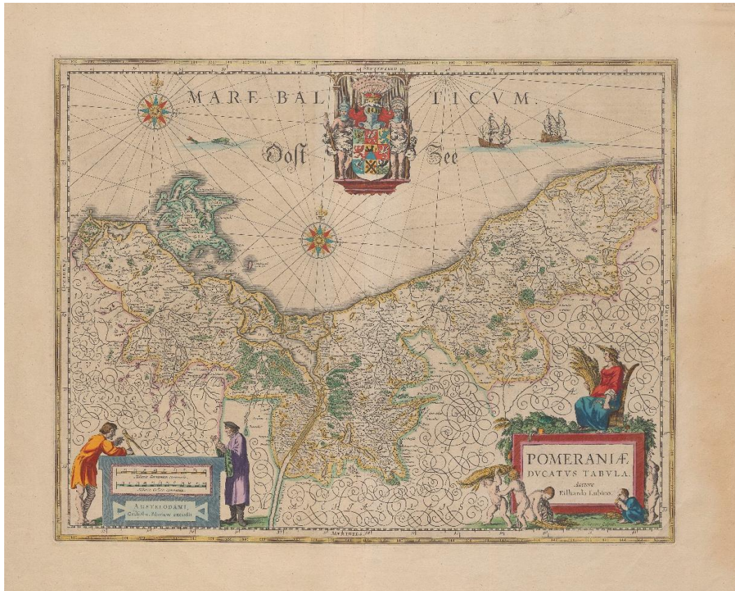
Atlasowa wersja mapy Eilharda Lubinusa, wydana w Amsterdamie przez Willema Blaeu'a w 1664 (Biblioteka Główna Uniwersytetu Szczecińskiego, Zbiory Specjalne, K. 1100)

W osobnym eseju omówione zostały sprawy związane z przełomem religijnym na Pomorzu, który nastąpił po śmierci Bogusława XIV. W tym miejscu należy tylko wspomnieć, że przyjęcie luteranizmu jako religii panującej w Księstwie pobudziło rozwój nauki i sztuki, dzięki czemu od II połowy XVI stulecia możemy mówić o „złotym wieku” kultury pomorskiej. Książęta stali się pierwszymi i najważniejszymi mecenasami, czerpiąc wzorce z Zachodu Europy. Realizacje takie, jak przebudowa zamku książęcego w Szczecinie, rozpoczęta za panowania Jana Fryderyka, budowa Kunstkammery Filipa II, zamówienie wielkiej mapy Księstwa u Eilharda Lubinusa to tylko niektóre z inicjatyw budujące splendor panujących.