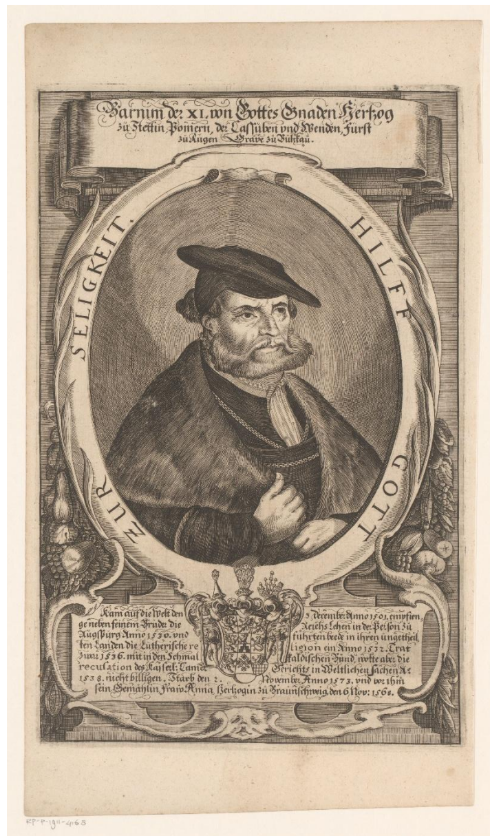
Portret Barnima IX, miedzioryt, Georg Walch, Niemcy, 1632 – 1654, DP

Obie części Księstwa, w wyniku losowania, objęli: część szczecińską Barnim IX Stary (w historiografii określany również XI; panował już w ostatnich dwóch latach rządów Jerzego I), zaś część wołoską właśnie wspomniany wyżej Filip I Pobożny. Od tej pory, aż do ponownego zjednoczenia za Bogusława XIV w 1625, mamy do czynienia z dwoma częściami Księstwa ( de facto z dwoma księstwami): Szczecińskim i Wołoskim.