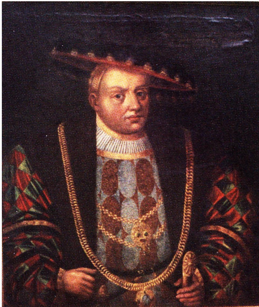
Portret Bogusława X, malarz nieznan, ok. 1650, PD, źródło: https://commons.wikimedia.org/wiki/File:Bogislaw_X_von_Pommern.JPG (dostęp: 21 III 2026)

Okres panowania księcia Bogusława X, zmarłego w 1523 roku, to czas przełomu – przejścia od monarchii średniowiecznej do państwa nowożytnego i kultury renesansu (także w wymiarze politycznym). Miał on dziewięcioro prawowitych dzieci: Krzysztofa (zm. ok. 1521), Annę (ur. 1491 / 1492, zm. 1550), Jerzego (1493–1531), Kazimierza (1494–1518), Elżbietę (zm. przed 1518), Zofię (ok. 1500–1568), Barnima (ok. 1500–1501), ponownie Barnima (1501–1573) i wreszcie Ottona (1502/1503–1518) oraz syna z nieprawego łoża Joachima (zm. ok. 1549). Po śmierci Bogusława w 1523 roku naturalnym dziedzicem był najstarszy żyjący syn Jerzy I. Książę był dwukrotnie żonaty; z pierwszego małżeństwa z Amelią Wittelsbachówną miał syna Filipa (1515–1560), o którym jeszcze będzie mowa. Po śmierci Jerzego, który panował ledwie 8 lat, doszło do ponownego podziału Księstwa na część szczecińską i wołogoską.