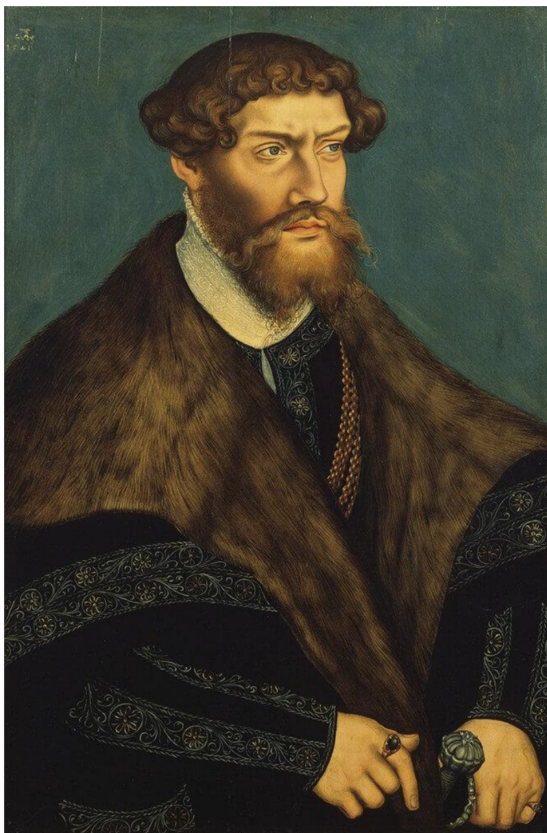
Portret Filipa I Pobożnego, Lucas Cranach młodszy, 1541, DP, zbiory Muzeum Narodowego w Szczecinie, źródło: https://commons.wikimedia.org/wiki/File:Filip_I_pomorski.jpg (dostęp 21 III 2026)

kilka tygodni, był kolejny syn Filipa I – książę Kazimierz VII (tylko w 1603). Po jego rezygnacji kolejne trzy lata to rządy Bogusława XIII, którego następcą w 1606 został Filip II Pobożny. Po jego śmierci w 1618 rządy (na dwa lata) przejął jego brat Franciszek, a następnie ostatni z Gryfitów na książęcym tronie – Bogusław XIV. Za jego rządów Księstwo Pomorskie ponownie zostało zjednoczone (1625), jednak splot niekorzystnych okoliczności – bezpotomna śmierć, wojna trzydziestoletnia i panowanie Szwedów na Pomorzu – sprawił, że Księstwo upadło i w ten sposób po 500 latach zakończył się okres pomorskiej państwowości i istnienia samej dynastii.